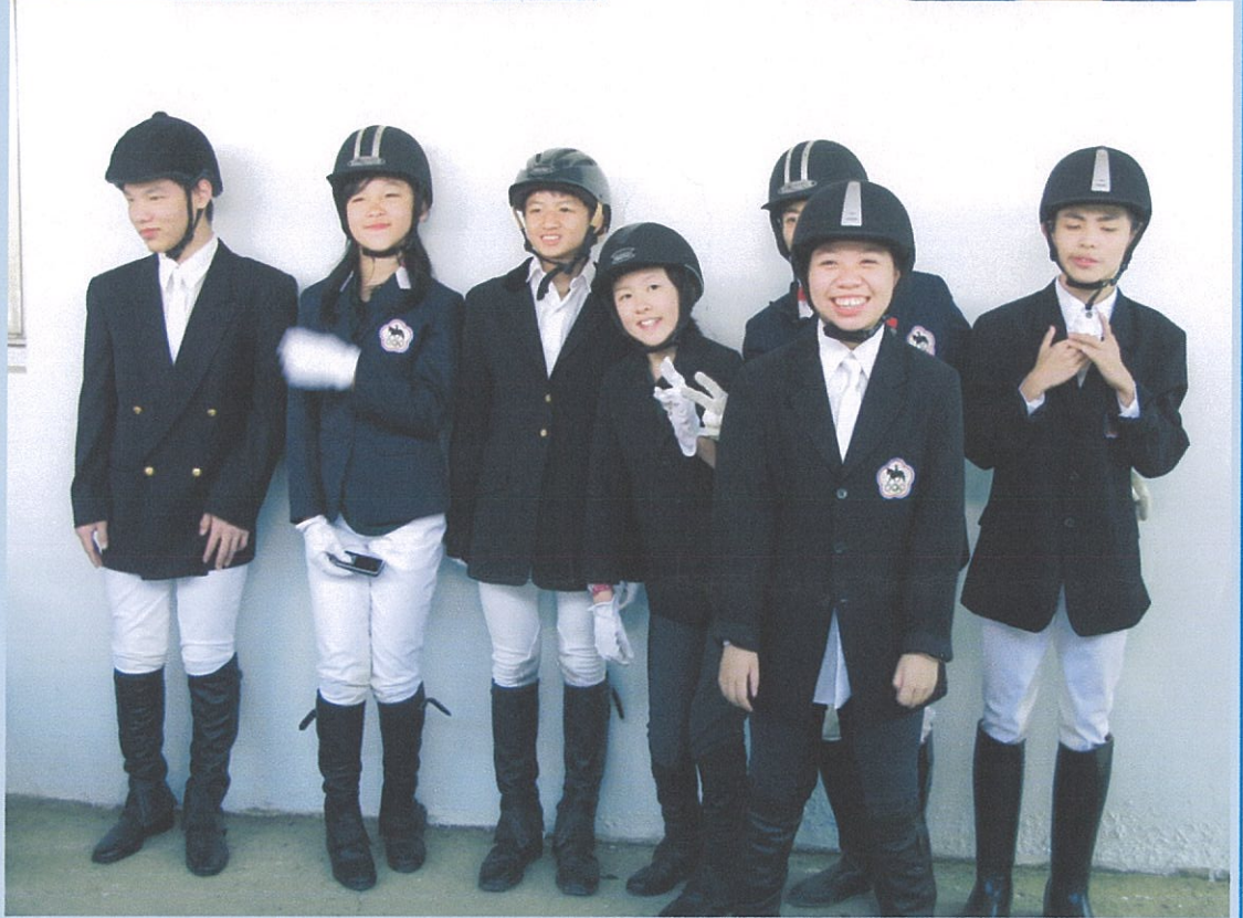
電影預告請搜尋：《小騎士闖通關之美夢成真》電影預告