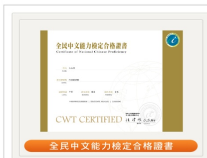
CWT全民中檢_中高等證書