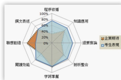
職場語文應用能力分析(優等)