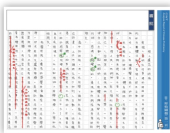
雙師詳批閱卷(初等-中高等)