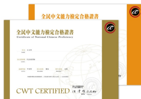
全民中文能力檢定合格證書