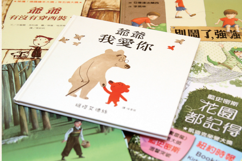
1 格林文化出版許多以祖孫為主題的童書繪本。

機，像是以前看電影要唱國歌、參加宴會要穿著正式服裝，都會藉由一個儀式，讓你對這件事情更為尊重。就像是書籍通常會設計一個扉頁、小書名頁，再來是大書名頁……。為什麼不直接進入書本的內容主題？因為要有一個儀式，現在要看書了，要準備好情緒，進入閱讀的狀態。當書本身是這樣設計的時候，行為也應該是這樣，自然會感受到閱讀是件重要的事情，就好像晨昏叩首、早上跟父母問安，生命中有這樣的儀式時，心情就會沉澱下來。