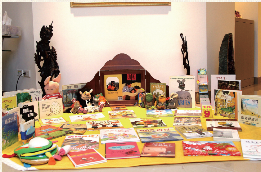
3 關於祖孫的童書繪本多元豐富。

祖父母在為孫子挑書時，自己至少要先閱讀過一遍，自己喜歡，同時對孫子來說也是適合的書籍，才是選書的準則。說故事時，祖父母也不必擔心自己國語發音不標準而退卻。其實，說故事不一定要使用國語，用自己的母語來詮釋圖書裡內容也是一種方式。母語的