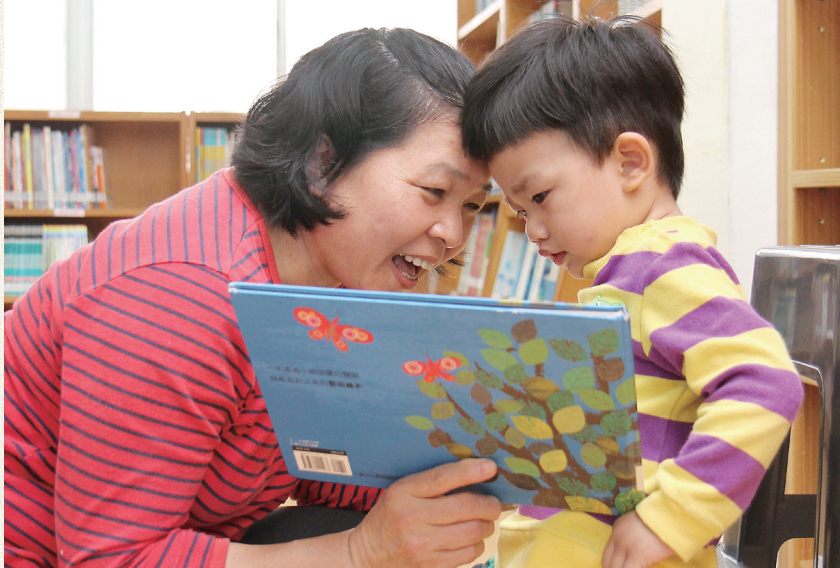
2 透過祖孫共讀增加彼此情感。