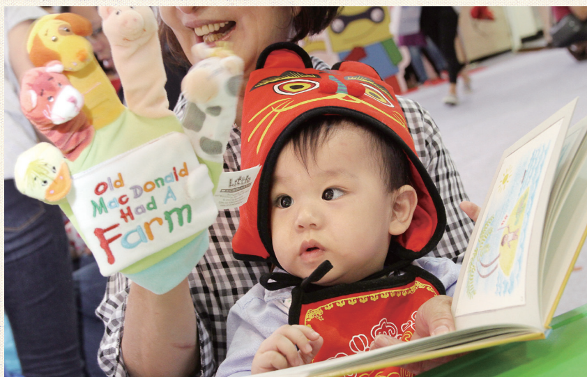
4 透過互動過程，拉近祖孫距離。

在祖孫共讀上，除了閱讀已出版的書籍，要加深孩子對書籍的感受，祖父母可以運用圖像剪貼、繪畫等方式，把孫子經歷的一個事件，或是把這一年來祖孫間較為特別的互動集結起來，做成一本手工故事書送給孫子。例如，在我兒子5歲時，我將他在4歲發生過的趣事編輯成圖書，作為生日禮物。其中一段故事描述：「他是我們家的開心果，也是我們家的好幫手，會照顧小孩也會看護老人。有一天，他和阿嬤一起去吃豆花，阿嬤那天吃了很多碗，他說：『阿嬤你怎麼呷那麼多碗？』阿嬤說，熬孫，沒看到店家寫呷7碗免錢。『阿嬤那是隔壁米糕呷7碗免錢，咱呷的每一碗攏愛錢。』哦！是這樣喔！」這件有趣的故事就會成為祖孫共同的記憶與情感的連結。🌀